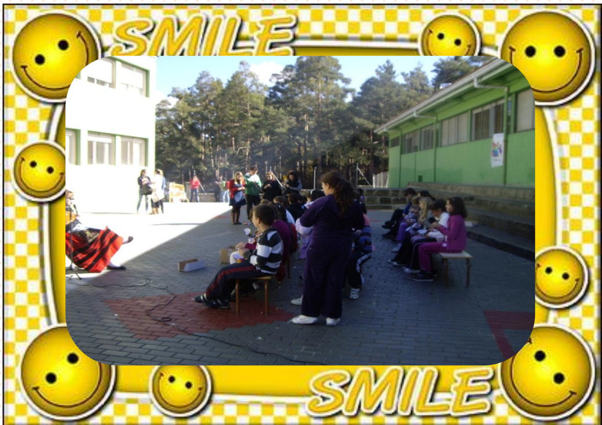
6º DE EDUCACIÓN PRIMARIA