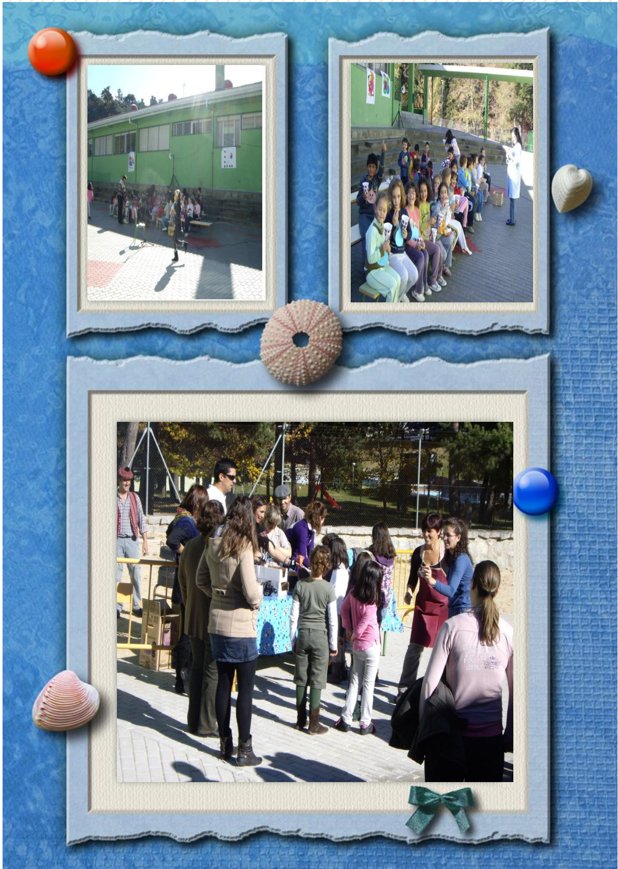
GRUPOS DE 1º, 2º Y 3º DE EDUCACIÓN PRIMARIA.