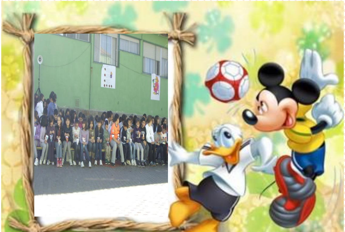
5º DE EDUCACIÓN PRIMARIA