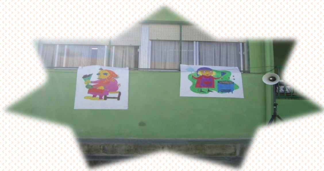
MURALES REALIZADOS POR EL GRUPO DE 4º DE ED. PRIMARIA.