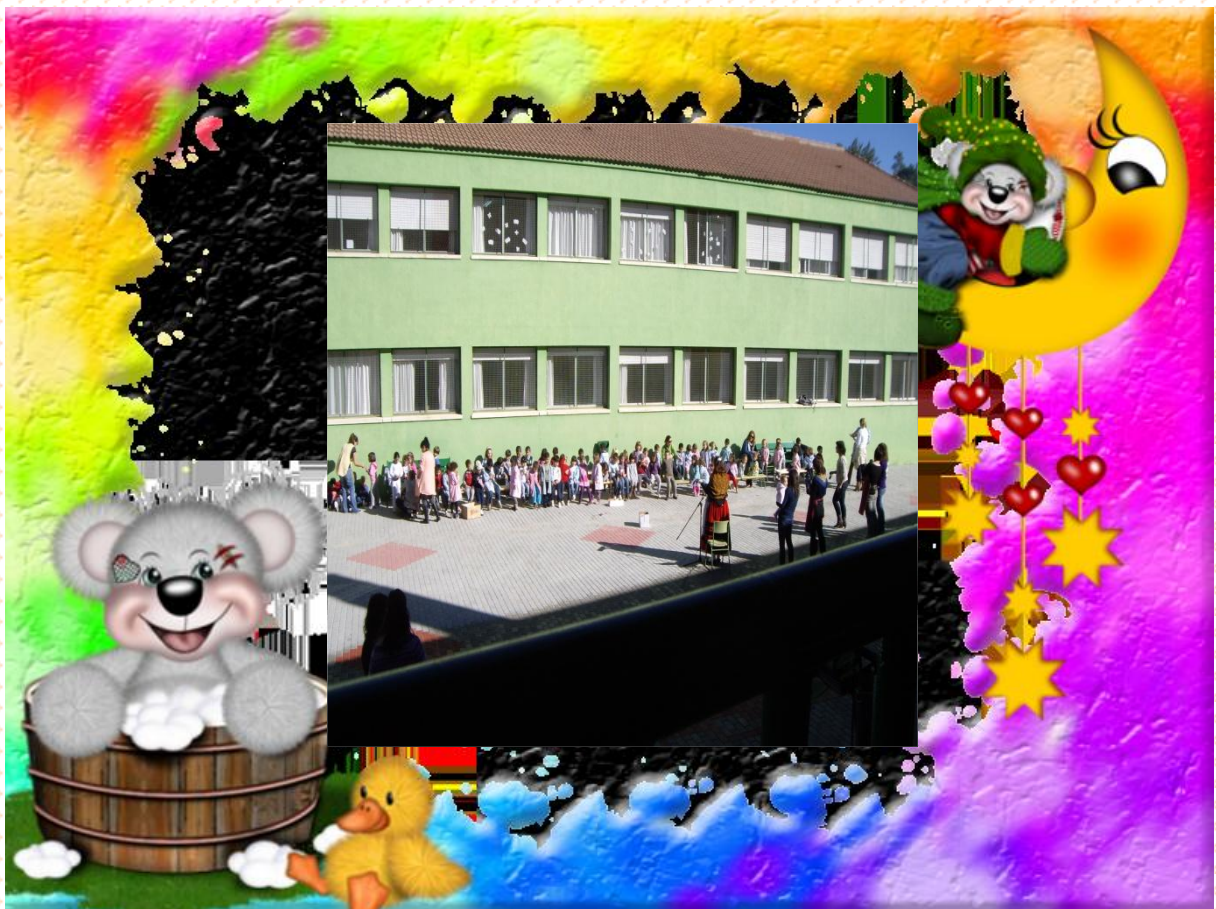
GRUPOS DE 4 Y 5 AÑOS CON SUS RESPECTIVAS TUTORAS.