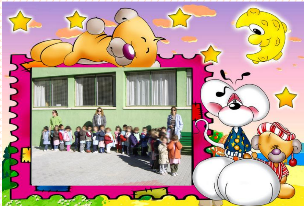
GRUPO DE 3 AÑOS A-B CON SUS RESPECTIVAS TUTORAS.