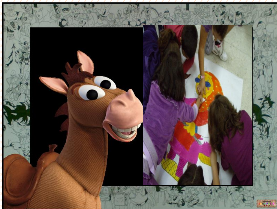
NIÑOS Y NIÑAS DE 4º DE EDUCACIÓN PRIMARIA