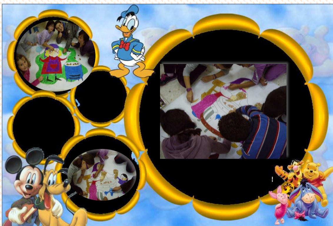
TRABAJO EN EQUIPO DE TODO EL GRUPO.